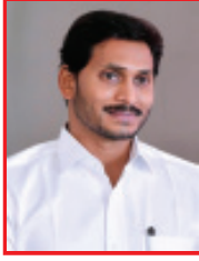
Y.S. JAGAN MOHAN REDDY